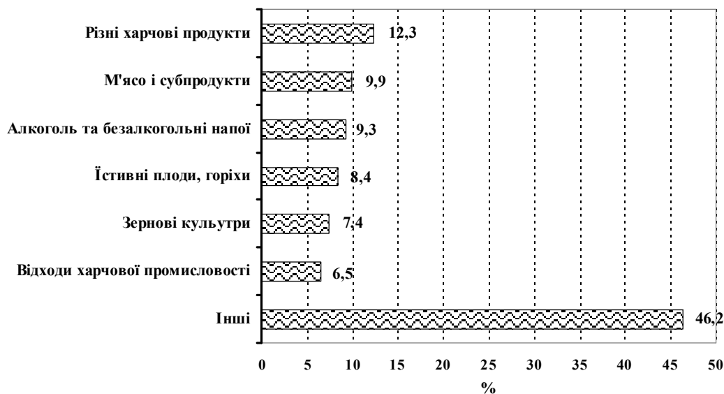
Рис. 3. Структура імпорту агропродовольчої продукції в Україну з ЄС у 2013 р.

Аналіз структури українського аграрного імпорту показує, що в ньому найбільша питома вага припадає на продукцію тваринництва, готові харчові продукти, алкогольні та безалкогольні напої, що надходять з країн ЄС (рис. 3).