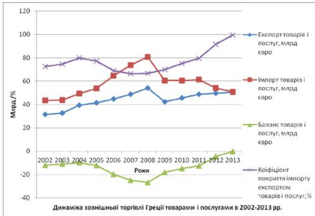
Рис. 3. Динаміка зовнішньої торгівлі Греції товарами і послугами в 2002–2013 рр. (графіки побудовані за даними Bank of Greece 2014) [23].

Результатом збільшення валютних надходжень туризму допоміг вперше з 1945 р., щоб збалансувати поточний рахунок Греції в 2013 р. і показує великий вклад туризму в економіку Греції, в уповільненні кризи платіжного балансу і підйомі ВВП в наступні роки (рис. 3).