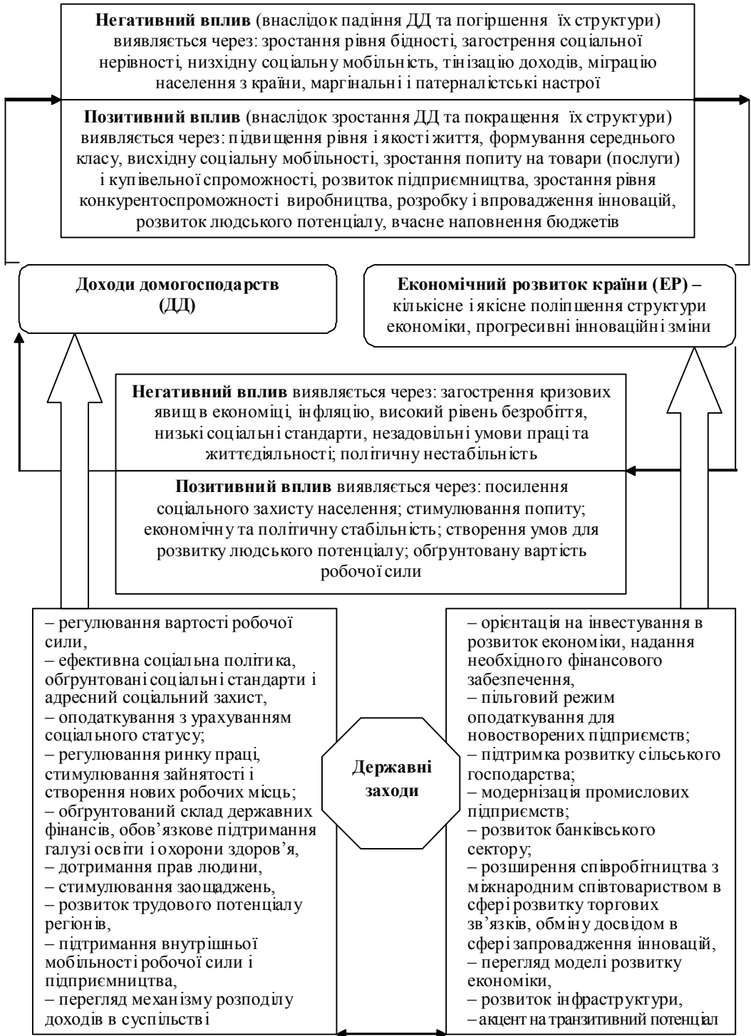
Рис. 2. Вплив динаміки обсягів і структури доходів домогосподарств на економічний розвиток держави